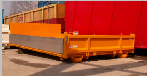
Abrollbehälter City mit festen Bordwänden